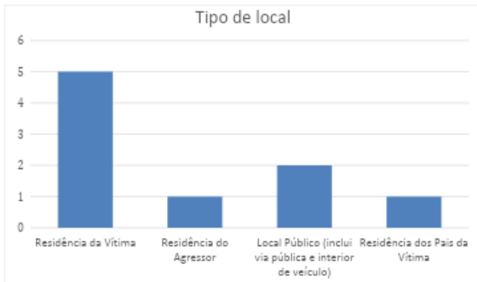
Gráfico 4: Ambientes onde as Vítimas de Femicídio (Tentado e Consumado) Foram Violentadas em Três Lagoas/MS - 2024