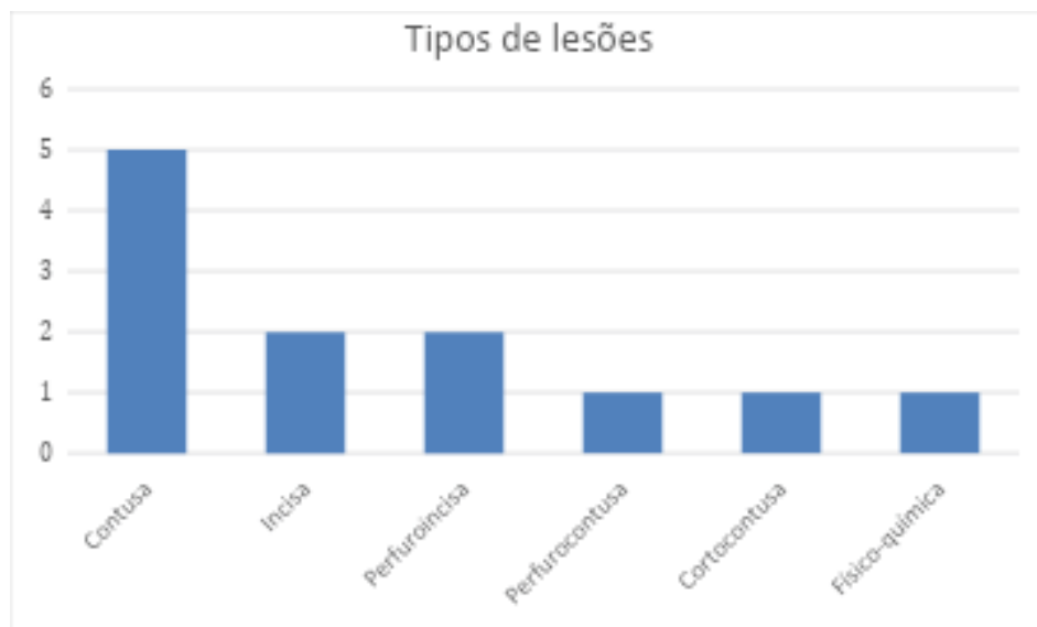
Gráfico 2: Tipos de Lesões Identificadas em Vítimas de Feminicídio (Tentado e Consumado) em Três Lagoas/MS - 2024

A análise dos casos estudados demonstra que, majoritariamente, os agressores produziram múltiplos tipos de lesões em uma mesma vítima, o que, sob a ótica pericial, pode ser interpretado como indicativo de comportamento impulsivo e de uma escalada de violência descontrolada. Entre os ferimentos constatados, prevaleceram as lesões contusas, seguidas, em frequência, pelas lesões incisas e perfuroincisas, refletindo a brutalidade dos ataques e a multiplicidade de meios empregados para a perpetração do ato feminicida.