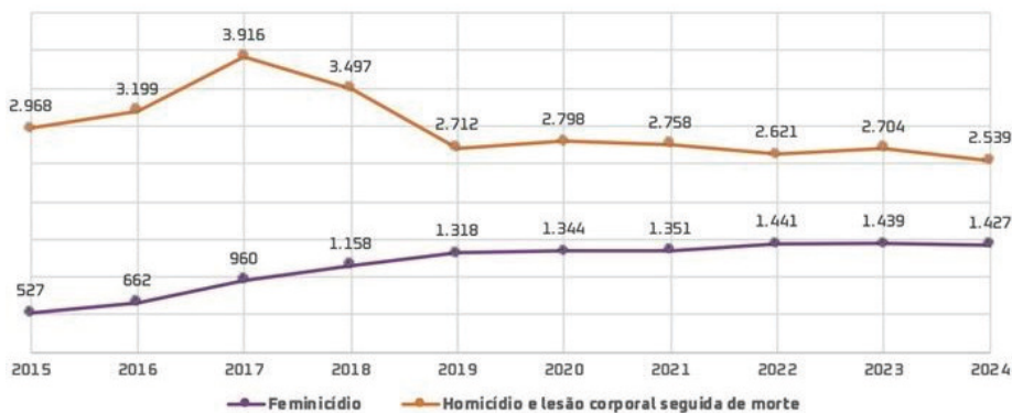
Figura 1 – Ocorrências Policiais de Feminicídio e Homicídio Doloso e Lesão Corporal seguida de Morte contra Mulheres, por ano (2015-2024) no Brasil

Fonte: Ministério da Justiça e Segurança Pública (2025).